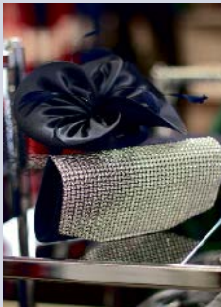
Accessoires bien choisis et conseils de la boutique Dumas, pour la réussite de la plus belle des occasions.

La stratégie est simple, pourrait-on dire : il faut acheter moins et mieux. Mieux, en ce sens que nous sommes contraints de créer nos collections avec beaucoup plus de précision que par le passé. En fonction de la marche des affaires, nous devons pouvoir nous réapprovisionner à court terme très rapidement. Ici aussi, nous devons être attentifs et veiller à proposer des articles faciles à réassortir. À noter que nous nous chargeons nous-mêmes des importations.